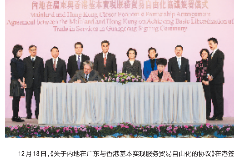
12月18日,《关于内地在广东与香港基本实现服务贸易自由化的协议》在港签署,《协议》即日生效并在2015年3月1日实施。图为当日,香港特区政府财政司司长曾俊华(前左)与商务部副部长高燕(前右)签署协议。