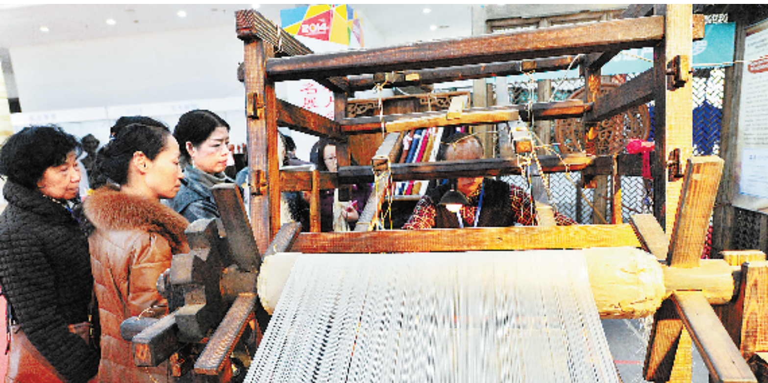
12月17日,第一届中国国际传统工艺技术研究会暨博览会在浙江世贸中心举行,展示了上百位工艺大师名品。图为展示的世界非遗——杭罗。

浙江音乐厅领略到了白居易笔下的琵琶曲,更有二胡、竹笛等多种精彩演奏曲目,让人大饱耳福。这次“新松计划”演出推出的是一批优秀青年演员,以独奏或协奏的形式,全方位展示了青年演奏员的风采。