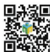
魔方书城网站二维码

倡议书共分三方面内容,包括提升审美品格,创作、传播更多既好看又耐看的网络文学作品;秉承职业精神,坚守责任底线、文学品格底线、道德风尚底线和法律法规底线;遵守法律法规,树立网络作家良好的知识产权保护形象等。让参与网络文化建设的作家、各平台、各行业共同为网络空间的更加清明作出贡献。