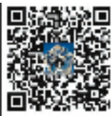
“魔方杯”新人王大赛专题