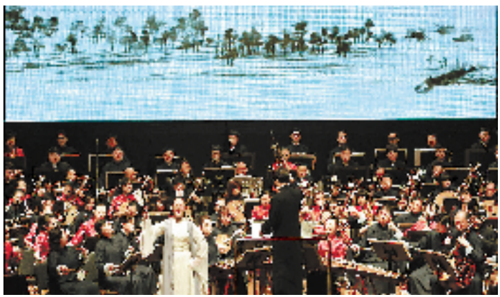
浙江民族乐团《富春山居图》新春亮相。

演唱。2015年3月5日,浙江交响乐团将在胜利剧院推出一台中西合璧的《迎新春·流行与经典交响音乐会》。曲目既有老百姓耳熟能详的音乐作品《新春乐》《康定情歌》《草原上升起不落的太阳》等,也有充满浓厚异域风情的乐曲《阿根廷探戈》《墨西哥风情》等,同时还将演奏原创大型交响乐音画《山·海·经》。整套音乐会力求内容丰富、形式活泼。