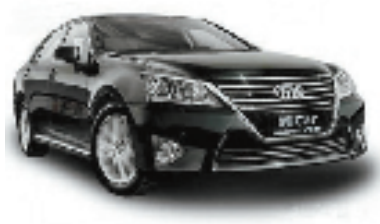
网上流传的“小米汽车”猜测效果图

仿佛是在跟乐视“抢头条”,靠千元智能手机起家、如今在智能手机市场占有一席之地的小米,近期也放出“造车”新闻。“小米汽车(内部代号米斯拉)已经开始量产”、“代工厂商为国内某大型B开头厂