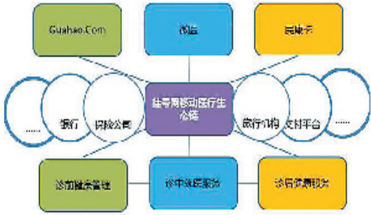
挂号网移动医疗服务生态链。