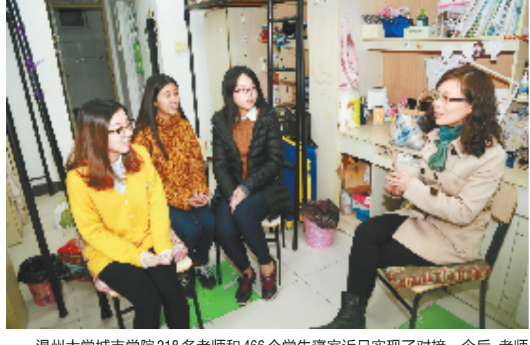
温州大学城市学院218名老师和466个学生寝室近日实现了对接。今后,老师将定期走到学生寝室,为学生答疑解惑,还会对学生的专业学习进行指导,甚至帮他们规划就业。