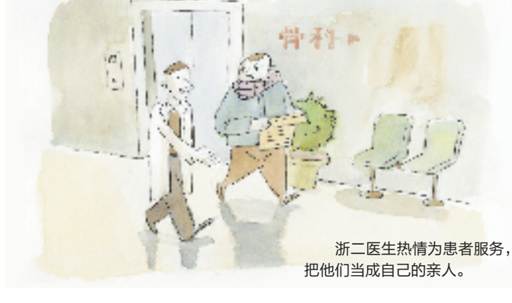
浙二医生热情为患者服务,把他们当成自己的亲人。