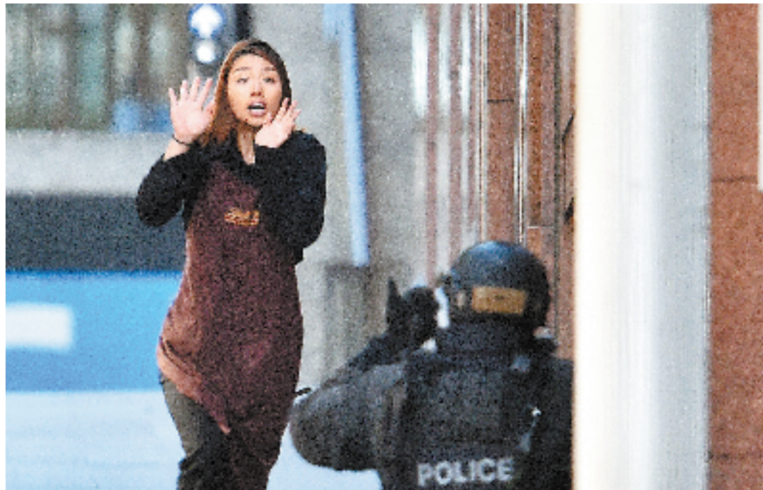
12月15日,在澳大利亚悉尼,一名逃出咖啡馆的人质跑向警察。