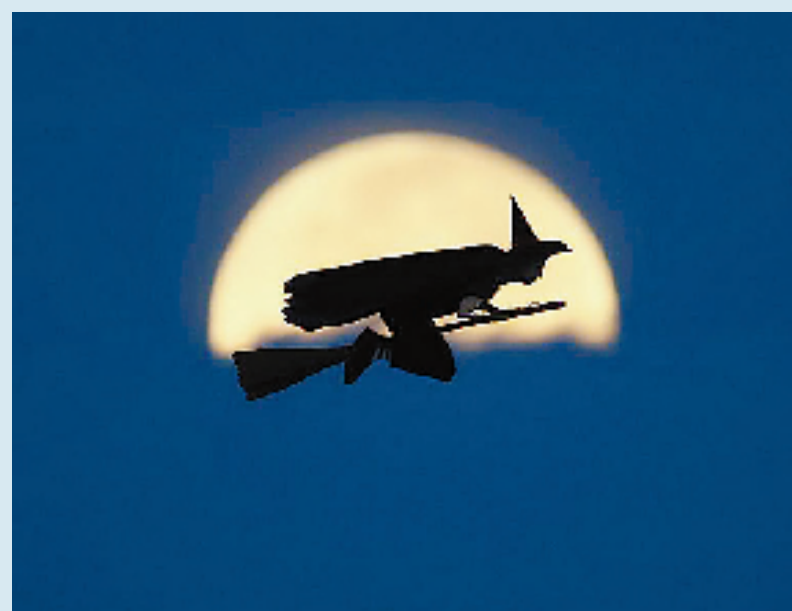
10月8日,美国加利福尼亚州一名飞行棋爱好者制作的无线电遥控“女巫”飞行器进行第三次试飞。把飞行器做成这样的形状还能顺利上天,让我们不得不惊叹发明者的奇思妙想。