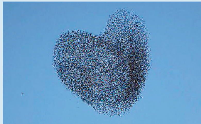
2月12日,就在西方情人节的前夕,以色列东南部一个鸟群在迁徙时拼成了心形图案。