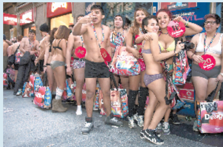
我们有每年一度的“双十一”和“双十二”,而欧美国家则有“黑色星期五”和圣诞节后的打折促销。世界各地都会出现为了抢购商品而通宵排队、争先恐后、摩肩接踵,甚至是大打出手的场面。1月7日,西班牙马德里开始冬季大减价,一家服装店举行“袒裸而入,整装而出”促销活动,前100名顾客如果只穿内衣进入卖场,即可免费挑选一身服装。不少顾客在店外彻夜等候。