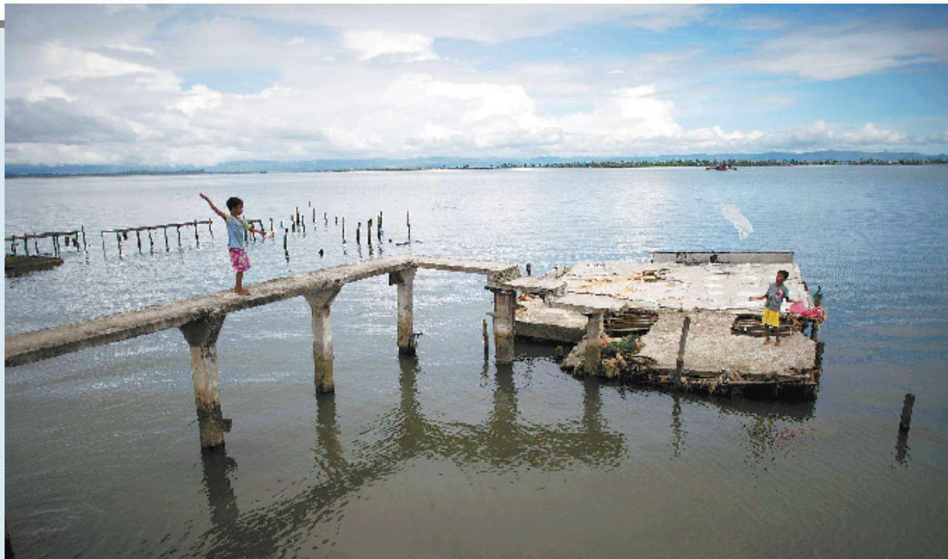
大人的世界里,苦难与幸福交织着复杂难辨。儿童的世界却很简单。无论身处何地何时,只要有玩具就是个小小的完美世界。玩具可能很精美,可能很粗糙,甚至有可能只是空气或水,但对孩子而言意义都一样,那就是欢笑和童年。10月17日,在菲律宾宾莱特省塔克洛班,两名儿童在被台风“海燕”带来的洪水摧毁的房屋废墟上放风筝。