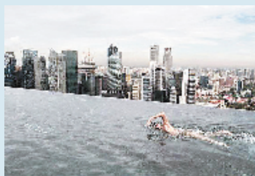
2014年5月20日,澳大利亚游泳世界冠军克里斯蒂安·斯普林格出席在新加坡举行的“新加坡泳星”记者会,并在滨海湾金沙度假酒店顶层泳池下水游泳。 视野网供图