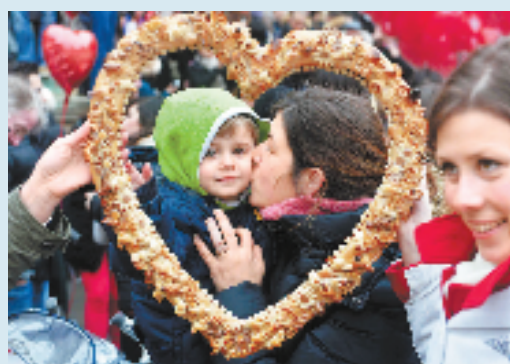
母亲,是人生最初的导师。无论贫穷还是富有,逆境还是顺境,她始终是孩子们最坚强的后盾,最强大的保护者。2月14日,在法国巴黎卢浮宫广场,一名母亲在激吻快闪活动中亲吻自己的孩子。