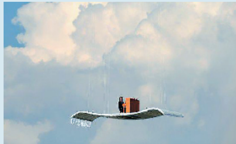
7月23日,德国慕尼黑机场,德国钢琴家斯特凡·阿龙携橘色钢琴搭乘铝制“飞毯”在空中弹奏。这是他“橘色钢琴之旅”的第四站。迄今他已到过很多常人难以想象的地方进行表演,包括瑞士的阿尔卑呼贝尔山(海拔4206米)和中国的长城。