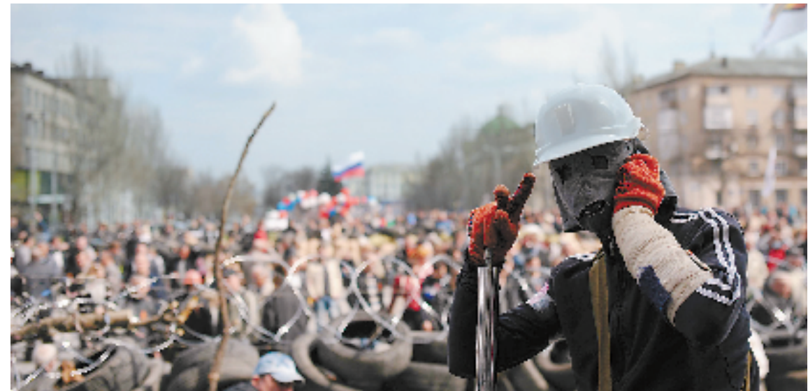
在乌克兰顿涅茨克,一名集会者站在政府大楼前。

2014年3月,乌克兰危机急剧升温。克里米亚加入俄罗斯联邦,引发了冷战以来最严重的东西方危机,俄罗斯与北约关系骤然紧张。4月,乌克兰东部顿涅茨克州和卢甘斯克州民间武装分别成立“人民共和国”,5月中旬举行独立公投后宣布建立“主权国家”。乌克兰政府随后对其展开“反恐行动”。