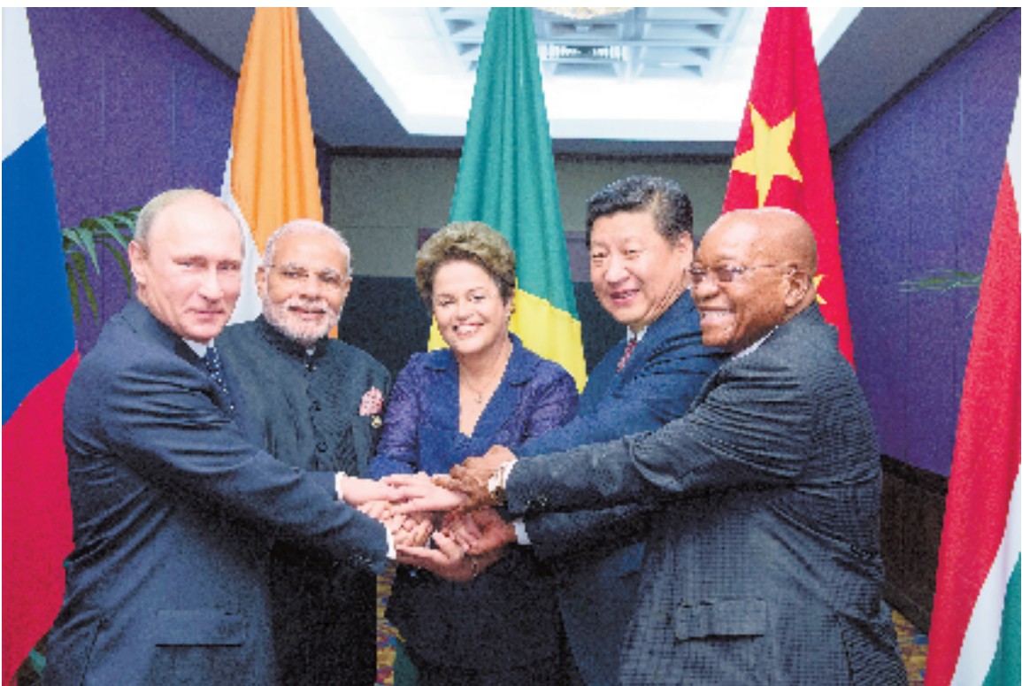
11月16日,金砖国家领导人非正式会晤在澳大利亚布里斯班举行。

2014年以来,从海牙核安全峰会、亚信上海峰会、金砖国家领导人福塔莱萨会晤、上海合作组织杜尚别峰会到 APEC 北京会议,从春花烂漫的春天到果实累累的秋季,中国领导人在多边外交场合充分展现了中国智慧和负责任的大国风范。