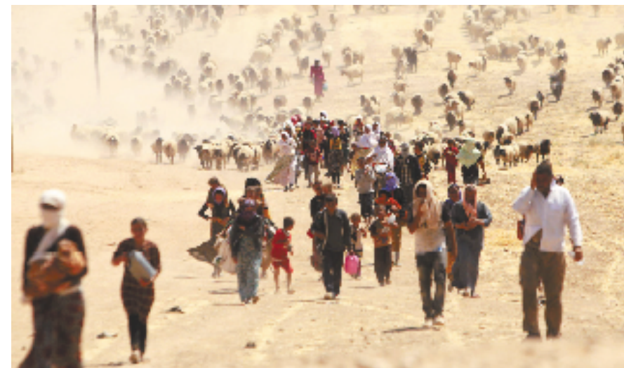
8月10日,在伊拉克辛贾尔山区外围,“雅兹迪”教派的难民前往叙利亚边境。

今年6月,“伊斯兰国”极端组织宣布在所控制的伊拉克和叙利亚领土建立了一个伊斯兰国家。