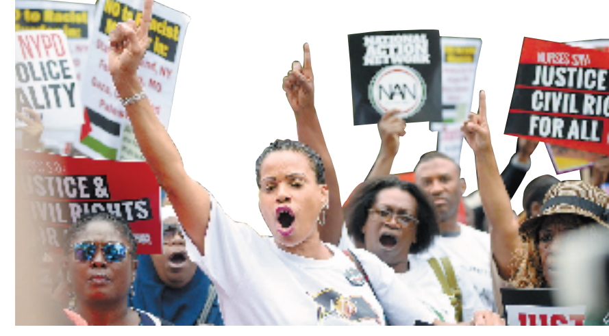
示威者手举标语在美国纽约市斯塔滕岛参加示威游行。

今年8月9日,非洲裔美国青年迈克·布朗在没有携带武器的情况下遭到白人警察达伦·威尔逊拦截搜查并被开枪打死。几个月来,这一事件持续发酵。