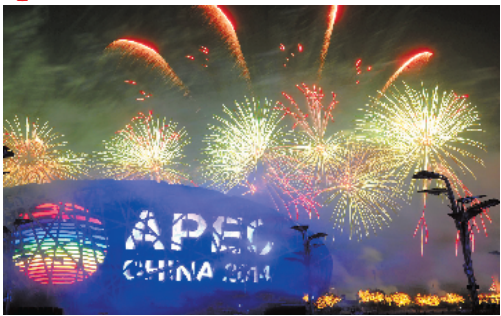
11月10日,北京在奥林匹克公园举行焰火表演。

今年秋冬之交,亚太经合组织(APEC)21个经济体伙伴齐聚北京,共商亚太发展大计,共谋亚太合作愿景,结下友谊,收获硕果,见证共同繁荣的梦想从北京起飞。这次会议堪称中国今年最重要、最繁重的主场外交,世界的目光聚焦亚太、聚焦中国、聚焦北京。