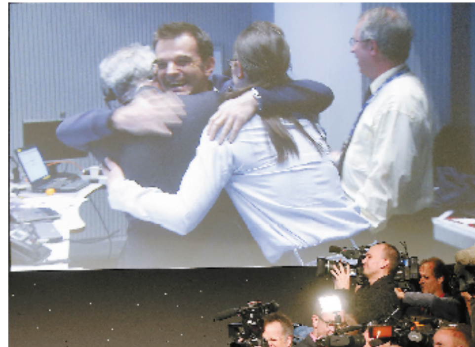
11月12日,控制人员在德国达姆施塔特的控制中心庆祝欧航局彗星着陆器“菲莱”成功着陆。

“罗塞塔”探测项目取名自埃及及罗塞塔石碑。人们期待,“罗塞塔”项目也能如古老石碑一样向人类揭示更多的宇宙奥秘。