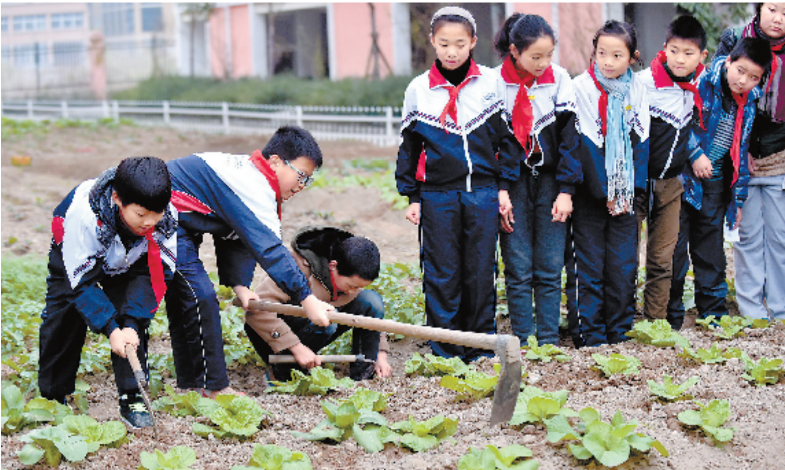
12月11日,丽水水阁小学的学生们正在农田里为蔬菜松土。水阁小学在校内建起“开心农场”,开设生态课堂,让学生识别农作物,学会简单农活。