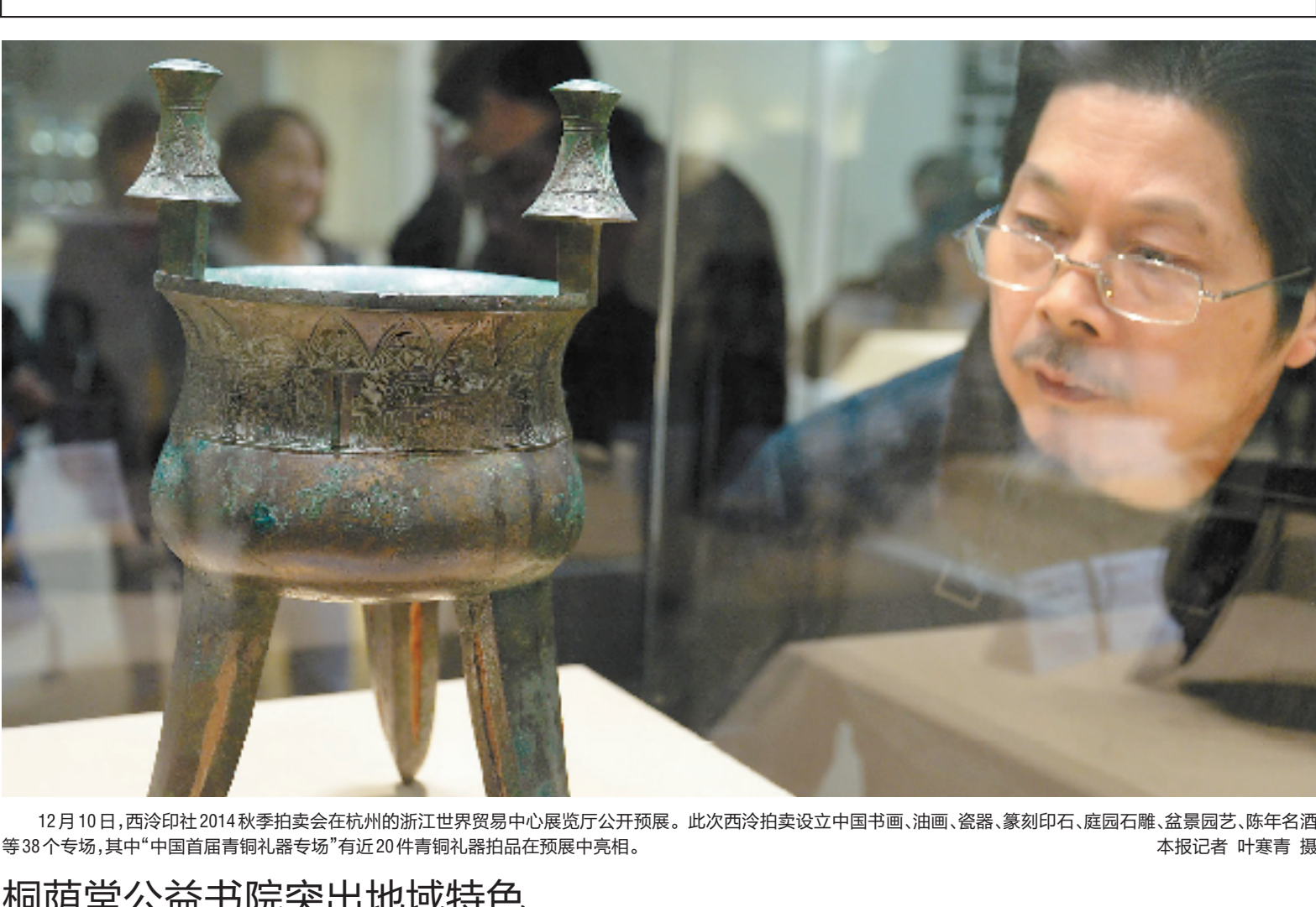
12月10日,西泠印社2014秋季拍卖会杭州的浙江世界贸易中心展览厅公开开展。此次西泠拍卖设立中国书画、油画、瓷器、篆刻印石、庭园石雕、盆景园艺、陈年名酒等38个专场,其中“中国首届青铜礼器专场”有近20件青铜礼器拍品在预展中亮相。

书长。幼承家训,少时便与书道结下不解之缘,临池不辍,涵泳先秦、两汉、六朝碑碣之间,兼涉南宗,转益多师。但于篆刻最勤,曾钩摹古玺印、汉印、皖、浙、赵、吴各名家3000余方,成六大册,其后书画之研习皆取金石气。作品集遴选20余年印作百余方,传递出闫大海对传统国艺的体悟与理解。