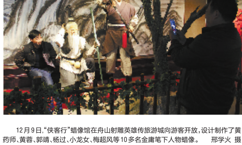
12月9日,“侠客行”蜡像馆在舟山射雕英雄旅游城向游客开放,设计制作了黄药师、黄蓉、郭靖、杨过、小龙女、梅超风等10多名金庸笔下人物蜡像。

蔡云超告诉记者,桐荫堂公益书院要为生活在美丽杭州的大众百姓,打开一个不一样的世界。在作家俞宸亭心里,优秀传统文化是中华文明的基因,要正视,要弘扬,要传播,更要使之沁人心脾。