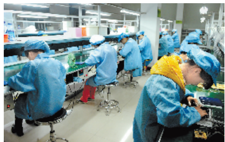
浙江博伟工贸有限公司近日与国内一家大型上市投资公司达成协议,引进16亿元资金,在武义9个工业园区建200兆瓦屋顶光伏发电厂,建立光伏产业园。图为博伟工贸有限公司生产车间内工人在焊接太阳能电池。

式光伏示范项目。该项目全部采用分布式安装,遵循“发自自用,余电上网”的原则,光伏组件安装面积384平方米,共安装240块太阳能多晶硅发电板,装机容量60.8千瓦,预计年发电量约7.98万千瓦时,相当于一个月均用电300千瓦时的居民用户22年的全部用电量。项目运行后,营业厅就能实现真正的“零排放”。此外,该营业厅还建有全省首个风光互补发电工程。