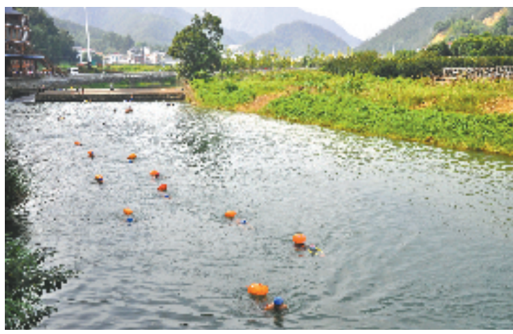
昔日“黑河”大洲溪可以游泳啦

前源溪,三都镇境内县级河道之一,发源于三都镇寿峰村,在三都村与后源溪汇合成三都溪,汇入富春江。1990年以前,沿线村民都在溪中挑水吃。此后,随着沿线生猪、蛋鸡养殖户增加,水质严重变差。今年以来,该镇对前源溪、后源溪进行集中整治,基本消除河岸沿线畜禽养殖多、河底淤积多、河面及堤坝杂草多,各种生活及建筑