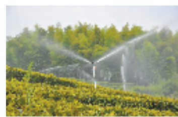
农业节水——茶园喷滴灌

以来,建德积极开展饮用水水源地环境整治,并加强长效管理;基本完成农村饮水安全提升新安江水厂管网延伸、乡镇水厂管网延伸、单村供水工程。铺设城镇供水管网20公里,改造提升8公里。城乡供水能力进一步提升,供水管网不断向农村延伸。