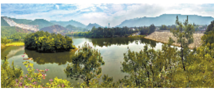
大同镇洞山水库除险加固工程

推出由11个部门共同参与的环境综合执法措施——“清水治污·环境整治零点行动”,采取不定期突击和暗查方式,开展环境联动执法行动63次,检查企业301家次。