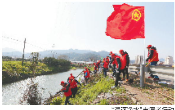
“清河净水”志愿者行动