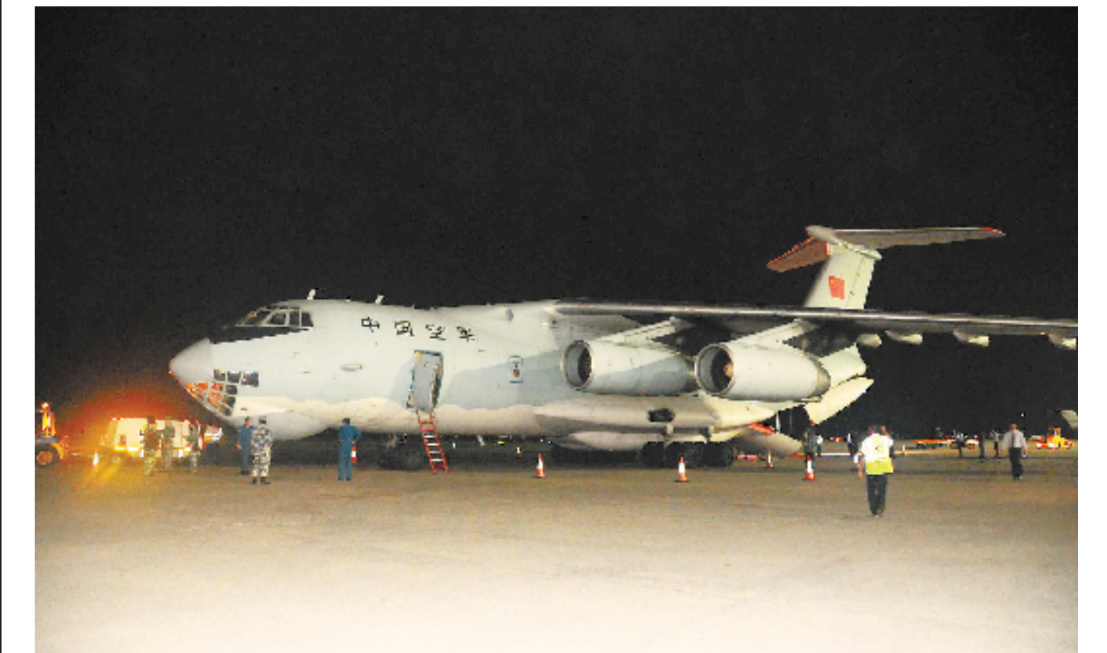
12月8日,一架装载着饮用水的中国空军伊尔-76飞机抵达马尔代夫首都马累。马尔代夫当地时间8日凌晨,来自中国的两架伊尔-76飞机运送40吨饮用水抵达马累,以帮助正在经历供水危机的10万马累居民渡过难关。

新华社马累12月8日电(记者 杨梅菊)中国人民解放军两架载有40吨矿泉水的伊尔-76飞机8日凌晨抵达马尔代夫首都马累,帮助马累居民度过缺水难关。