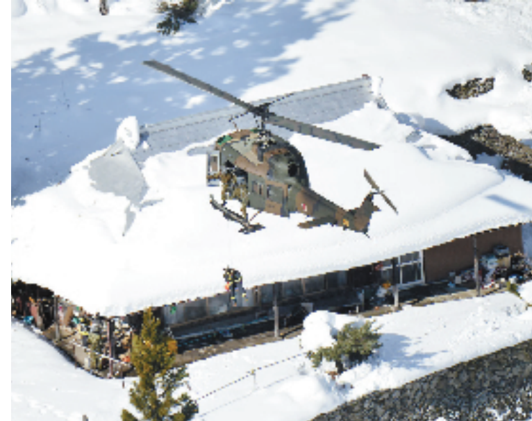
12月8日,在日本德岛县,日本自卫队救援人员乘直升机抵达灾区。据当地媒体报道,日本德岛县近日遭遇雪灾,造成至少6人死亡,数百人因交通中断被困。