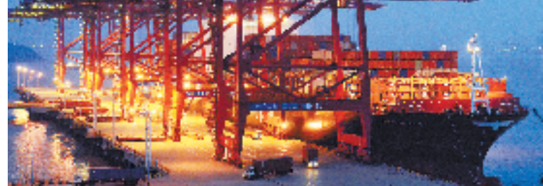
12月7日,来自中东航线的“美总查尔斯顿”集装箱轮首靠定海区金塘大浦口码头,进行三千多自然箱的装卸作业。

自开展“个转企”提质扩面暨长效机制建设年”活动以来,椒江市场监管局为逐步破解目前农业发展普遍存在的资源要素、生态环境、市场变化等制约因素,率先将家庭农场、物流配送、农产品销售等涉农主体作为“个转企”引导对象,通过政策再出台、服务再升级、程序再优化等一系列贴近涉农主体的利好举措,促使涉农主体由小规模分散经营向规模化、集约化、产业化经营转变。