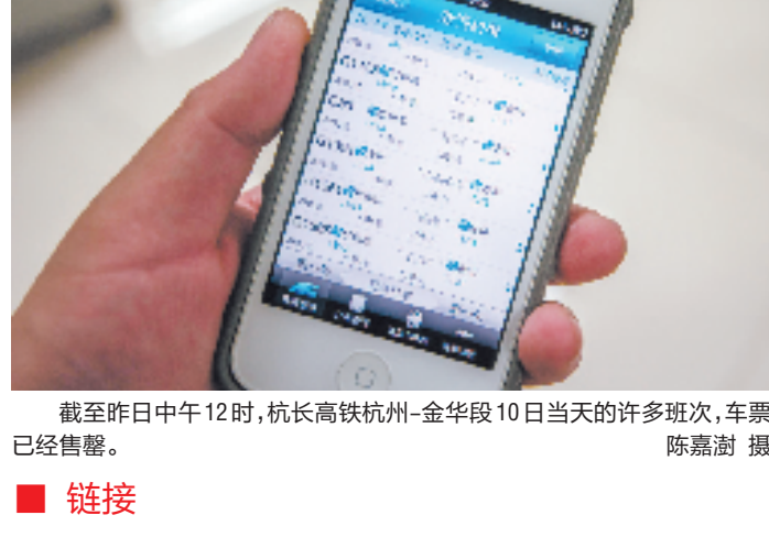
截至今日中午12时,杭长高铁杭州—金华段10日当天的许多班次,车票已经售罄。

从目前杭州往各地的铁路运行图分析,今年可能出现车票紧张的主要是昆明和郑州以远(西安、兰州)方向。