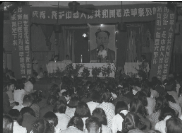
浙江干部群众庆祝宪法草案公布。