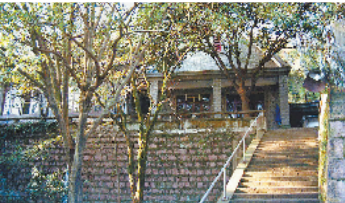
北山街84号30号楼边的平房——毛泽东在杭州主持起草《中华人民共和国宪法(草案)》办公地址。