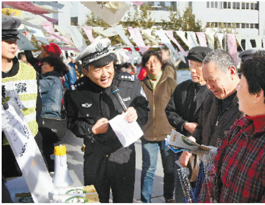
12月2日,舟山市交警支队在定海文化广场举行“12·2全国交通安全日”主题宣传活动。

去年11月22日下午2时,一辆绍兴牌照的白色奔驰车开上嘉绍大桥。车子上桥时,时速达168公里,短短4公里路,时速飙到211公里,该司机成了嘉绍大桥开