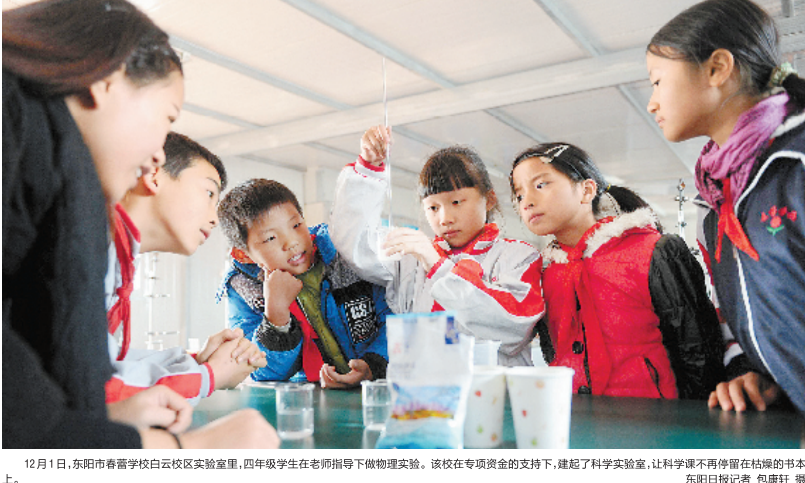
12月1日,东阳市春蕾学校白云校区实验室里,四年级学生在老师指导下做物理实验。该校在专项资金的支持下,建起了科学实验室,让科学课不再停留在枯燥的书本上。