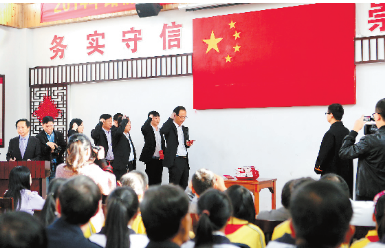
日前,台州路桥区开展村干部向宪法宣誓活动,增强基层干部学法守法意识。