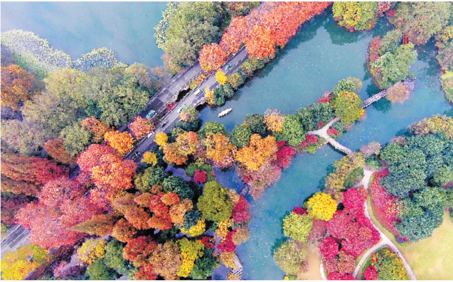
周末一波冷空气,将杭州带到了冬天的门槛。记者赶在冷空气来临前,用航拍飞行器拍下了西湖杨公堤卧龙桥附近最后的秋色。