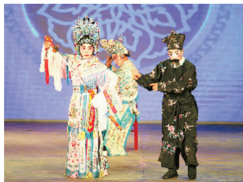
松阳高腔历史悠久,被誉为我省戏曲界的活化石,其剧目、唱腔、表演自成格局,是国家级非遗项目。12月1日,松阳高腔剧团将随浙江代表团赴新加坡、印度等地进行旅游文化推介交流活动,让世人进一步了解这一民间文化瑰宝。