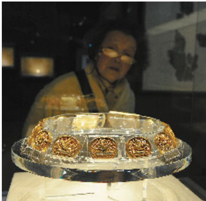
鸚鵡纹鎏金银腰带。