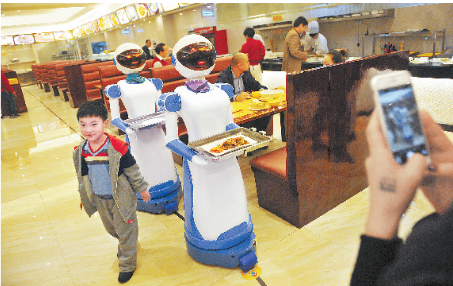
慈溪一家餐厅推出机器人送餐服务,新奇的创意吸引许多市民前去体验。

同时参加革命工作。历任山东省莒南县大店区粮库会计、主任,县壮岗区粮库主任,浙江省嘉兴县公安局审讯股股长、副局长、局长,副县长,县委常委、组织部部长,县委常委、副县长,嘉兴第二医院党支部书记,嘉兴县卫生局局长,县公安局教导员、党组书记,嘉兴市(县级市)人大常委会副主任、政法委副书记等职。