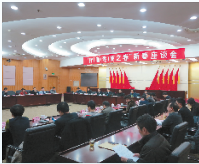
“2014浙(湖)商之春”新春座谈会

浙商回归的“集结号”已经吹响,湖州将着力引进一批战略性新兴产业项目、现代服务业重大项目、现代农业重大项目、传统优势企业、科技创新项目以及紧缺急需人才,这也正是浙商们回归的最佳时机!