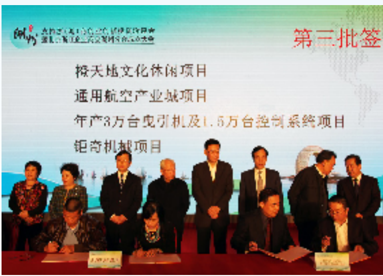
湖州市支持浙(湖)商创业创新(北京)投资洽谈会暨项目签约仪式

增速保持高位。浙商回归是扩大有效投资的重要抓手,湖州的浙商回归省外到位资金增幅远高于全市固定资产投资增幅,保持高位运行。2013年,浙商回归省外到位资金144.58亿元,同比增幅为61.8%,远高于固定资产投资