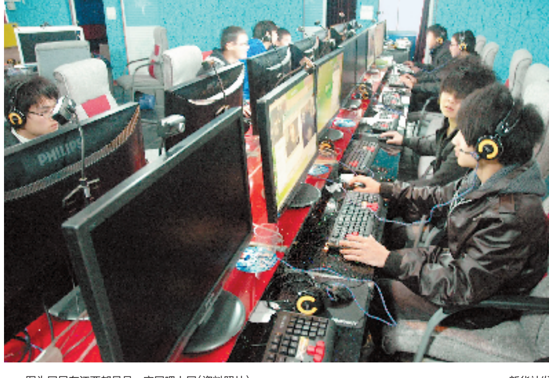
图为网民在江西都昌县一家网吧上网(资料照片)。