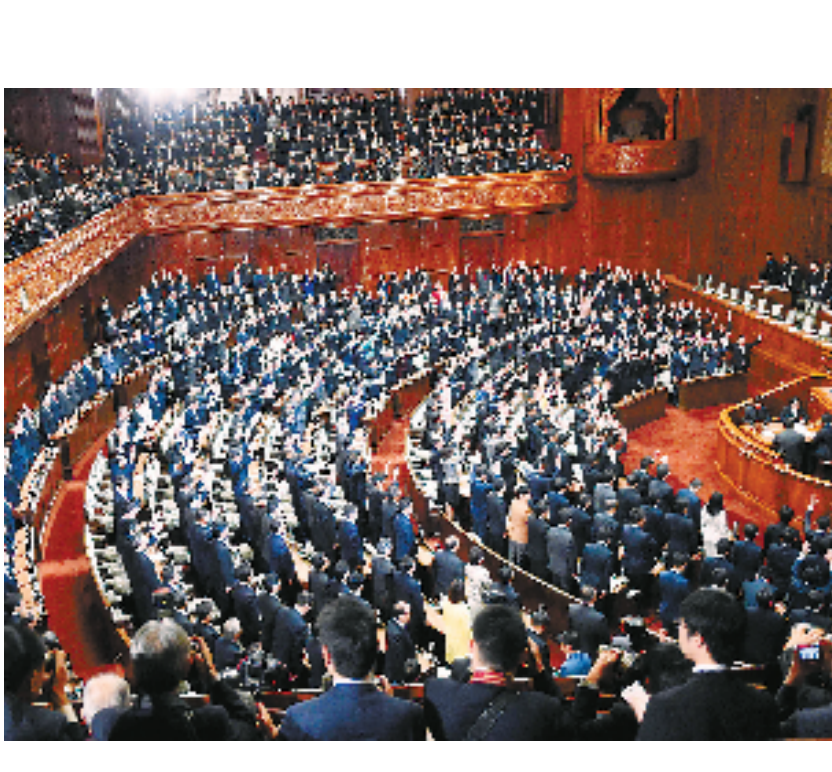
11月21日,在日本东京,国会众议院举行全体会议。日本首相安倍晋三当日上午解散日本国会众议院,准备提前举行大选。