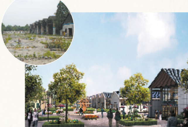
运河天地(左上图为原大河造船厂)