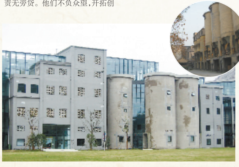
凤凰国际创意园(右上图为原双流水泥厂)