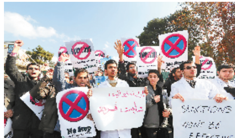
据伊朗媒体23日报道,一名伊朗核问题谈判代表23日表示,伊朗核问题谈判要在原定截止日期前达成全面协议已“不可能”,谈判可能延期。图为当日,在伊朗首都德黑兰,学生参加示威,支持伊朗核项目。