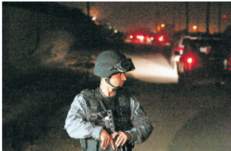
11月19日,在阿富汗首都喀布尔,一名士兵在一处自杀式爆炸袭击现场附近执勤。

但根据他的最新决定,2015年,驻阿美军将有权对威胁美军士兵或其他武装人员展开军事行动;如果有塔利班武装人员直接为“基地”提供支持,美军也有权采取相应措施。