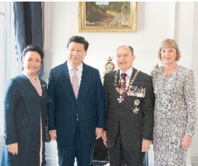
11月20日,国家主席习近平在惠灵顿出席新西兰总督迈特帕里举行的欢迎仪式。这是欢迎仪式后,习近平和夫人彭丽媛同迈特帕里夫妇合影。