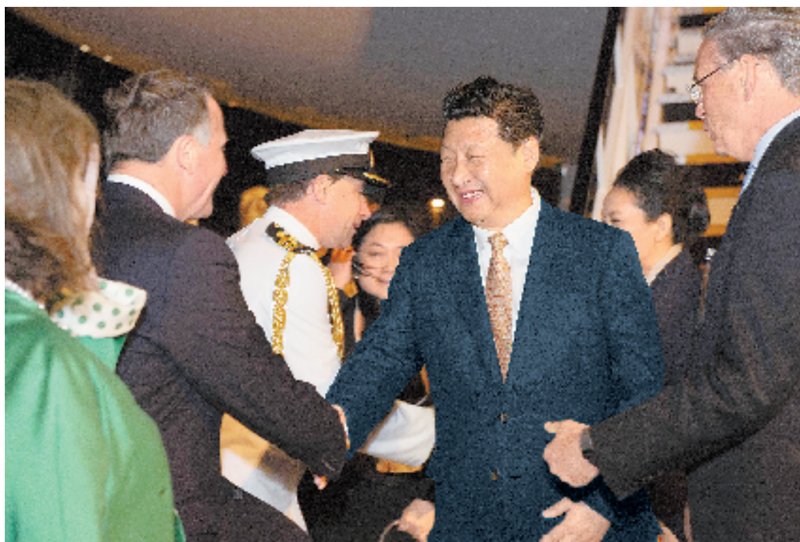
11月19日,国家主席习近平抵达奥克兰,应新西兰总督迈特帕里和总理约翰·基邀请,开始对新西兰进行国事访问。这是在奥克兰国际机场,习近平和夫人彭丽媛受到新西兰总督代表沃克、总理约翰·基夫妇、奥克兰市长布朗热情迎接。

中新关系走过的历程表明,相互尊重和平等相待是两国关系保持健康稳定发展的牢固基石;优势互补和互利共赢是两国务实合作快速拓展的强大动力;敢为人先和求同存异是两国关系始终走在同发达国家关系前列的不竭源泉。中新关系发