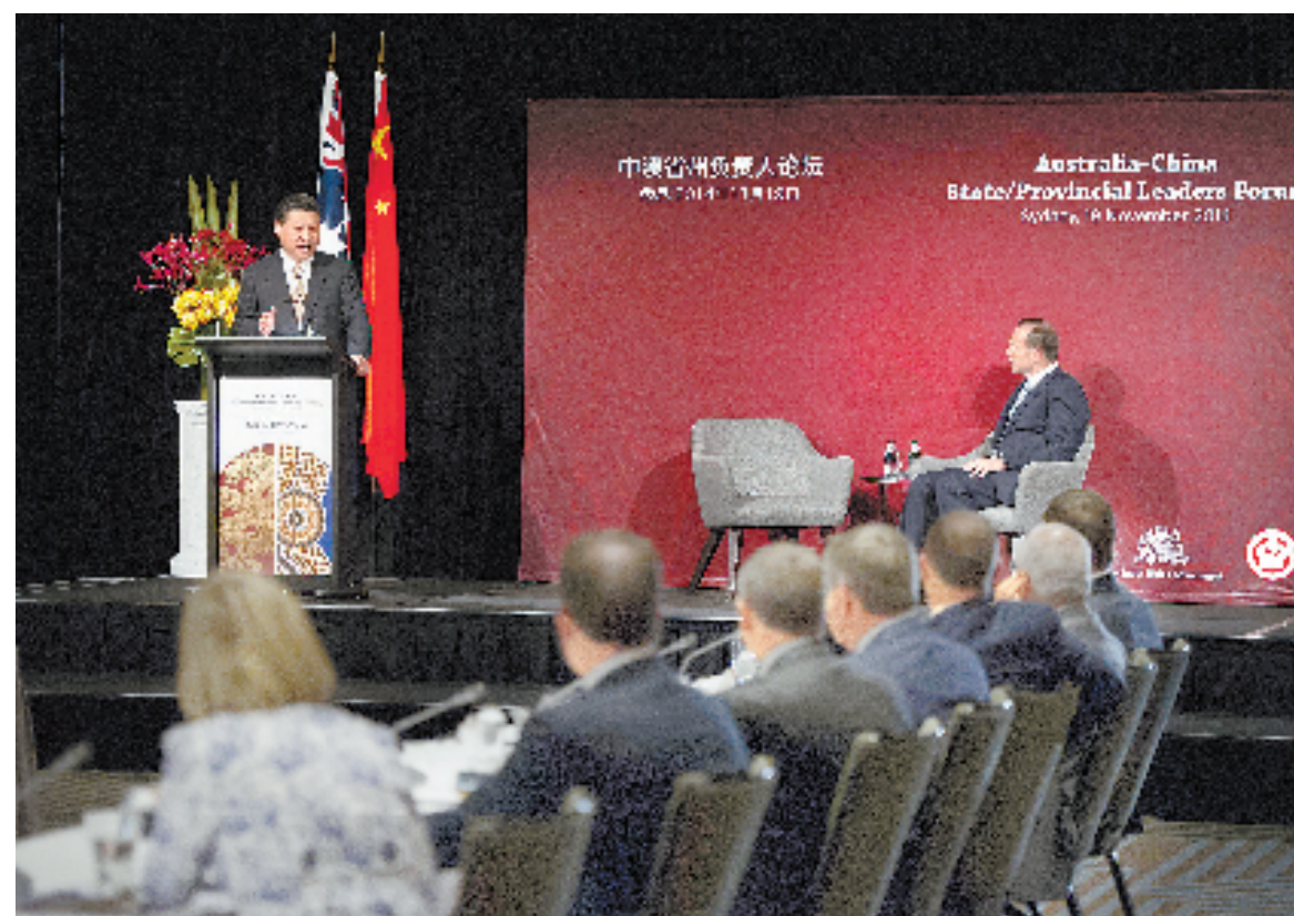
11月19日,国家主席习近平在悉尼与澳大利亚总理阿博特共同出席首届中澳省州负责人论坛。这是习近平在论坛上致辞。

席访问澳大利亚的又一重要成果,也是两国关系中的又一特殊意义的大事。论坛召开恰逢澳中建交全面战略合作伙伴关系、实质性结束双