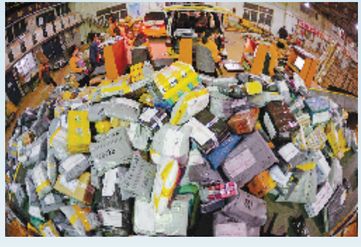
网购狂欢袭来,让物流快递业务量猛增。

发生奇妙的化学反应,一个是撬动中国经济的基础单元,一个是驱动中国经济增长的全新引擎,二者融合为中国经济的跨越式发展注入了全新的活力。”阿里巴巴副总裁叶朋说。