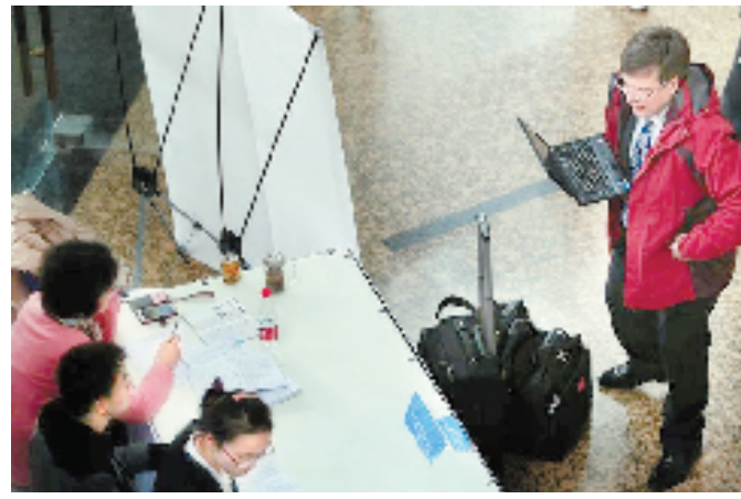
大批国外记者来到乌镇。