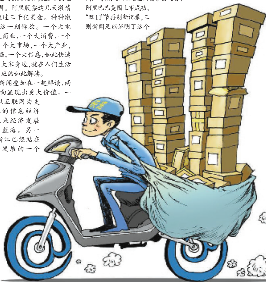
“双11”快递海量来袭。 漫画 李宏宇