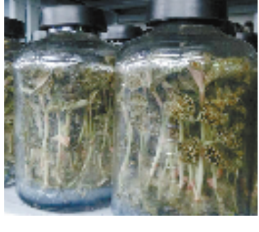
在瓶中培育的金线莲。