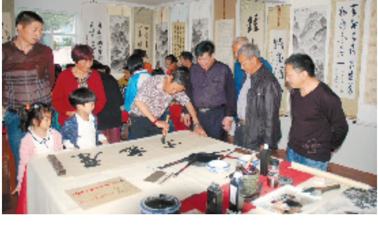
在临海杜桥镇南屋村,村民喜爱书法,闲暇之时经常挥毫书写。正因如此,还吸引了椒江区章安镇、邻近的小芝等乡镇书友前来切磋交流。该村还成为临海市唯一的“浙江书法村”。