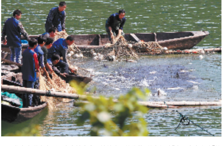
龙泉市道太乡利用古窑址众多和地处库区的优势,着力打造“水上青瓷之路”的乡村文化休闲旅游品牌,成为龙泉旅游的一个亮点。图为渔民在向游客展示拉网捕鱼。