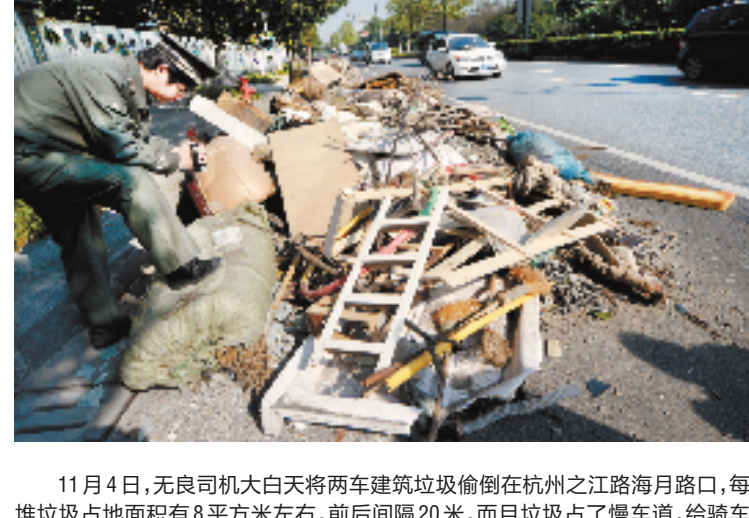
11月4日,无良司机大白天将两车建筑垃圾偷倒在杭州之江路海月路口,每堆垃圾占地面积有8平方米左右,前后间隔20米,而且垃圾占了慢车道,给骑车人带来事故隐患。垃圾去哪儿,问题越来越凸显。

三是政府倡导、舆论引导、房企力促。绿色环保的精(全)装修房既省工省料省时、又省心省事省力,需形成社会共推的强大合力。我省11个设区市应把推进住宅精(全)装修列入新型城镇化工作之中。特别是省会杭州更应先行一步,新建商品房精装修比例在近内力争达到80%。房地产开发商应提供不同风格、物美价优的精(全)装修房,要着眼用户的个性化需求,努力降低建设成本并提高性价比,并切实做好售后保修、维保工作,消除住户对精(全)装修房的后顾之忧。提升市民对精(全)装修房的认知和认同,媒体要用多种形式开展宣传教育,以逐步转变百姓的住宅观念和消费习惯。精(全)装修房要更多地普惠低收入群体,不断满足人民群众对“高、中、低”不同档次精装修房的需求。(作者均为浙江省人民政府参事)