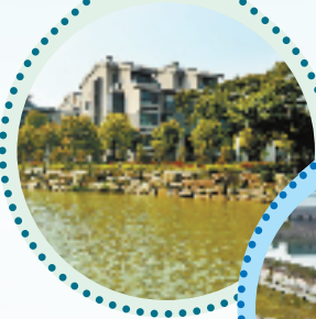
瑞安市陈岙中溪河道生态建设工程