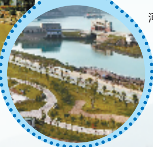
洞头县南塘河河道生态建设工程