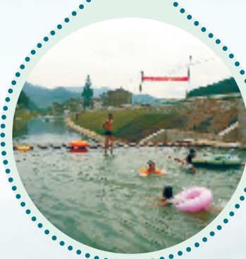
永嘉县大岩镇水牛塘溪河道生态建设工程