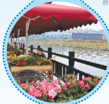
温州经济技术开发区纬四浦河道生态建设工程