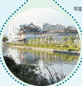
瑞安市仙降西河河道生态建设工程