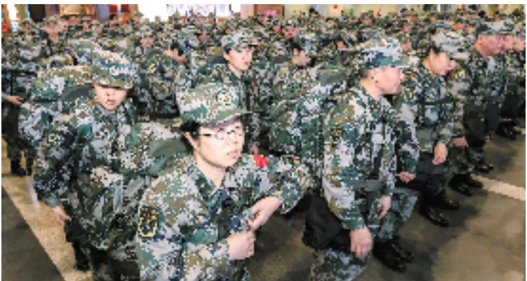
11月14日,赴非医疗队员在北京首都机场整装待发。当晚,我国派出的4支医疗队伍将从首都国际机场出发,前往非洲援助抗击埃博拉疫情。