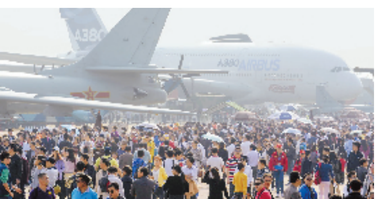
11月14日,第十届中国航展现场人潮汹涌。当日,第十届中国国际航空航天博览会迎来首个公众开放日。