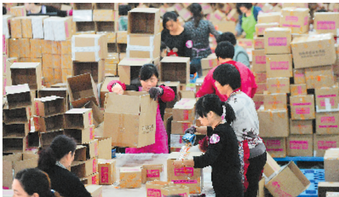
长兴科技园的电商奋战双十一。

一年一度的双十一备货也成为生产商的订单旺季,曾经主打圣诞供货的浙江义乌小商品市场,已把重心悄然转变为双十一购物狂欢节供货。“电子商务改变