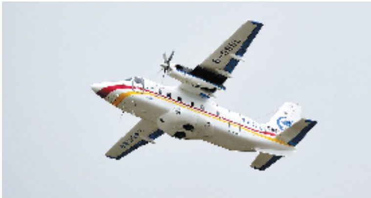
第十届中国珠海航展期间,中航工业直升机哈飞与美国维信航空公司签署20架运12系列飞机销售合同,包括18架运12E和两架运12F飞机。这是国产民用飞机首次出口发达国家,具有里程碑的意义。图为11月13日,运12F飞机在第十届中国珠海航展上进行飞行表演。新华社记者 梁旭 摄

在检验检疫领域的合作。墨方愿意尽快推动墨对华出口烟草和奶制品议定书的谈判签署工作,批准更多符合注册要求的墨西哥牛肉和猪肉企业对华出口产品。 14、扩大矿业领域合作。双方将发挥好今年10月签署的《中墨地质矿产部门谅解备忘录》的作用,推动矿业领域调查、评估、勘探和信息建设合作。墨方参加了今年10月在天津举行的2014年中国国际矿业大会,双方表示愿继续通过此类活动推动在矿业领域的投资合作。 15、在《中国国家工商总局与墨西哥工业产权局签署关于工业产权合作谅解备忘录》的框架下,继续推动相关知识产权领域的合作。 16、落实好《中国国家发展和改革委员会和墨西哥经济部关于促进产业投资与合作的谅解备忘录》,挖掘关键产业部门的投资机遇,加强投资政策和相关服务的推介工作。 17、通过制定落实《海关行政互助协议》的工作计划,推动双方在检验检疫领域的相互了解、合作与经验交流,并继续加强在中墨政府间两国常设委员会经贸分委会海关工作组框架下的对话交流。 18、双方将共同努力,确保第九届中国—拉美企业家高峰会于2015年在墨西哥瓜达拉哈拉成功举行。