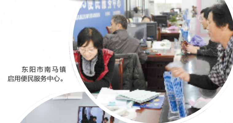
东阳市南马镇启用便民服务中心。