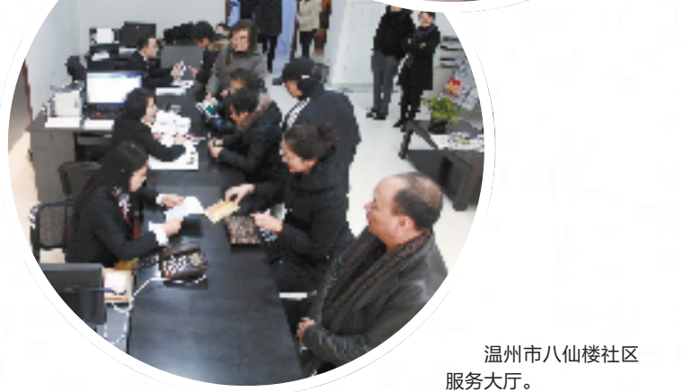
温州市八仙楼社区服务大厅。