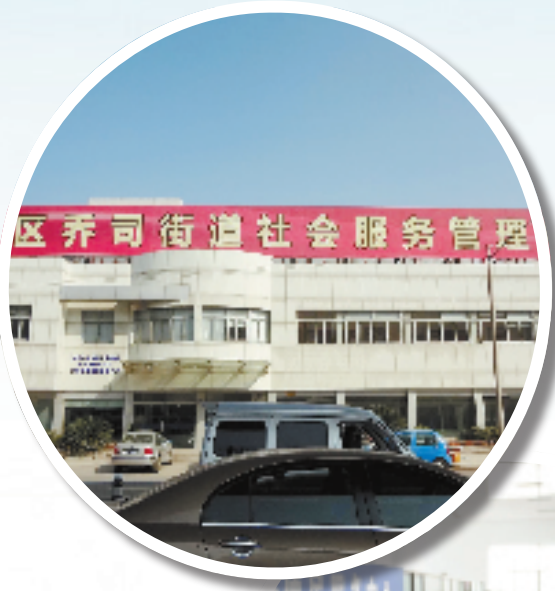
余杭区乔司街道社会服务管理中心。

社会服务管理中心,让乔司街道实现了社会面貌“由乱到治”的转变。如今,街道也从省、市综治部门挂号的治安重点镇,多次被省委、省政府命名为综治工作先进集体和示范乡镇。