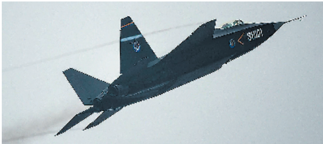
在珠海航展上亮相的运-20运输机(上)和歼-31战斗机。