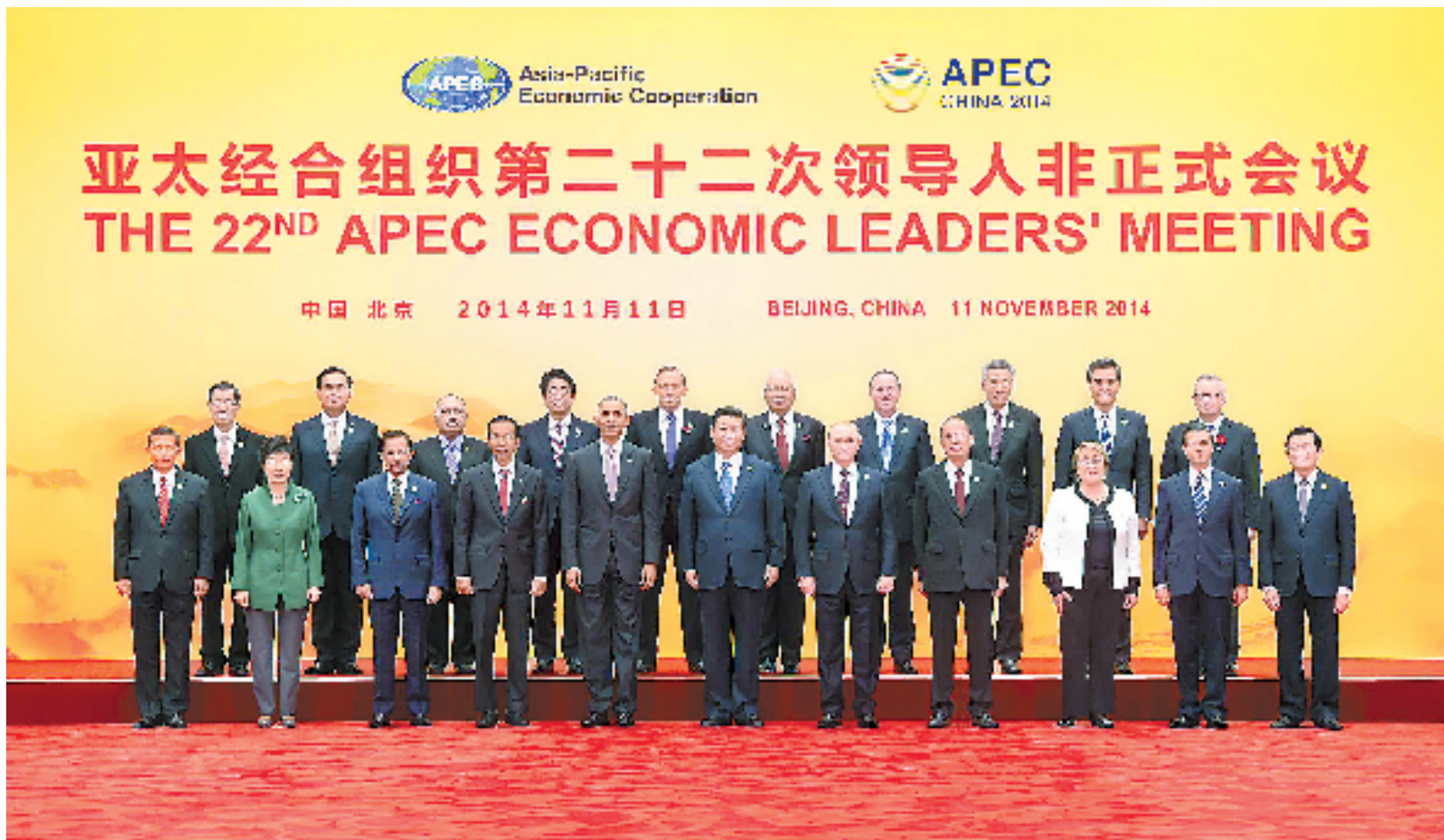
11月11日,亚太经合组织第二十二次领导人非正式会议在北京怀柔雁栖湖国际会议中心举行。这是各经济体领导人或代表集体合影。