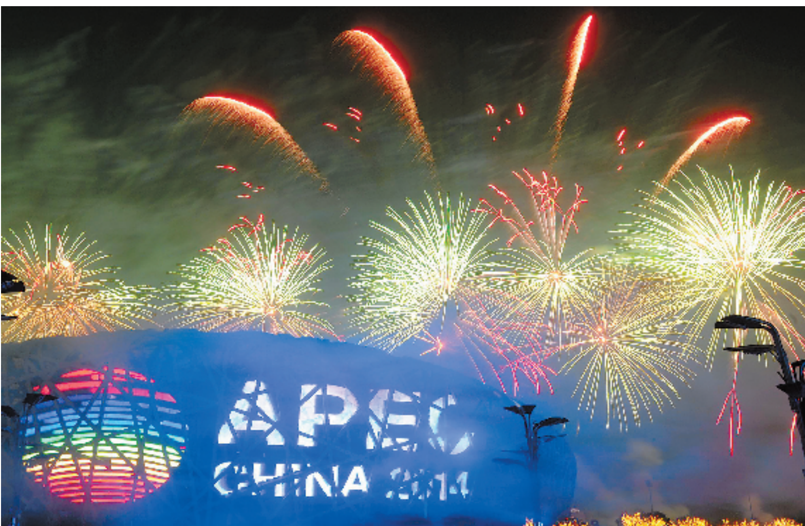
11月10日,北京在奥林匹克公园举行焰火表演。