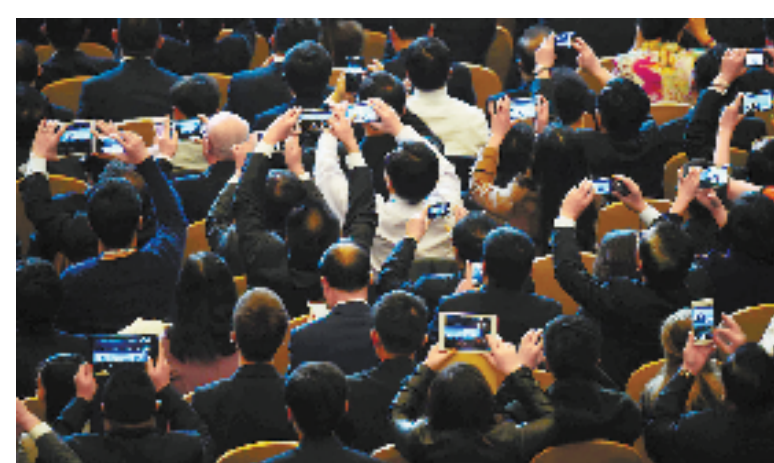
这是与会嘉宾在2014年亚太经合组织(APEC)工商领导人峰会上拍照(11月10日摄)。

工商领导人峰会是 APEC 系列会议中的重要组成部分,每年在 APEC 领导人非正式会议期间举办。从2000年开始,中国每年都派企业家代表团出席 APEC 工商领导人峰会。菲律宾将主办下届 APEC 工商领导人峰会。