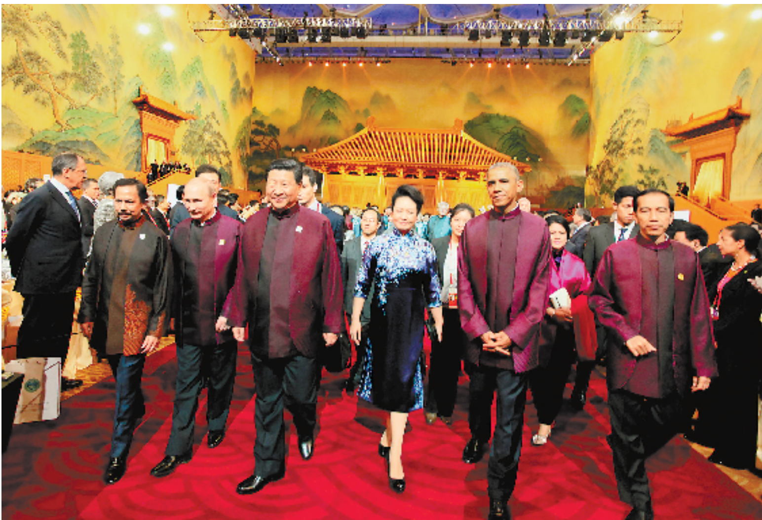
11月10日晚,国家主席习近平和夫人彭丽媛在北京国家游泳中心(水立方)举行宴会,欢迎出席亚太经合组织第二十二次领导人非正式会议的各成员国经济界领导人、代表及配偶。这是领导人步入宴会大厅。