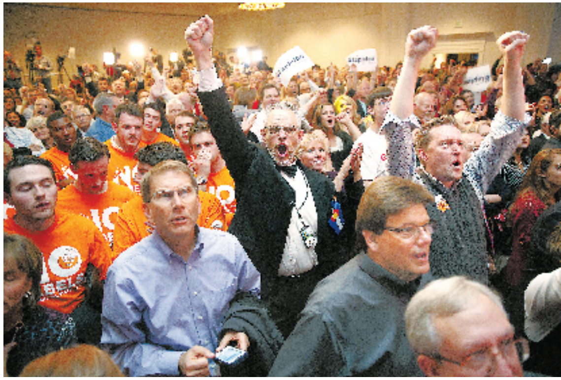
11月4日,在美国科罗拉多州丹佛,共和党支持者们庆祝共和党赢得国会参议院控制权。

在共和党“一统国会”的局面下,变成“跛脚鸭总统”的奥巴马在余下的两年任期内,注定会在更激烈的府院博弈中度过。但这也并不意味着奥巴马政府在外交方面没有可发挥的余地。