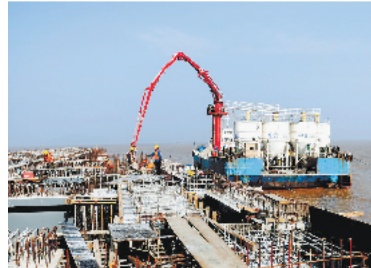
浙江省重点建设工程——浙能台州第二发电厂卸煤码头目前已进入施工高峰。该项目建设3.5万吨级卸煤码头,其长度为292米,宽28米,年设计通过能力470万吨,承担台二发电厂工程两台百万千瓦发电机组电煤输送重任。该码头计划在今年年底前完成土建施工任务。