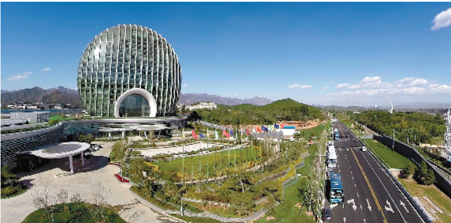
这是航拍的位于怀柔雁栖湖畔的日出东方凯宾斯基酒店。2014年亚太经合组织(APEC)领导人会议周活动于11月5日至11日在北京举行。