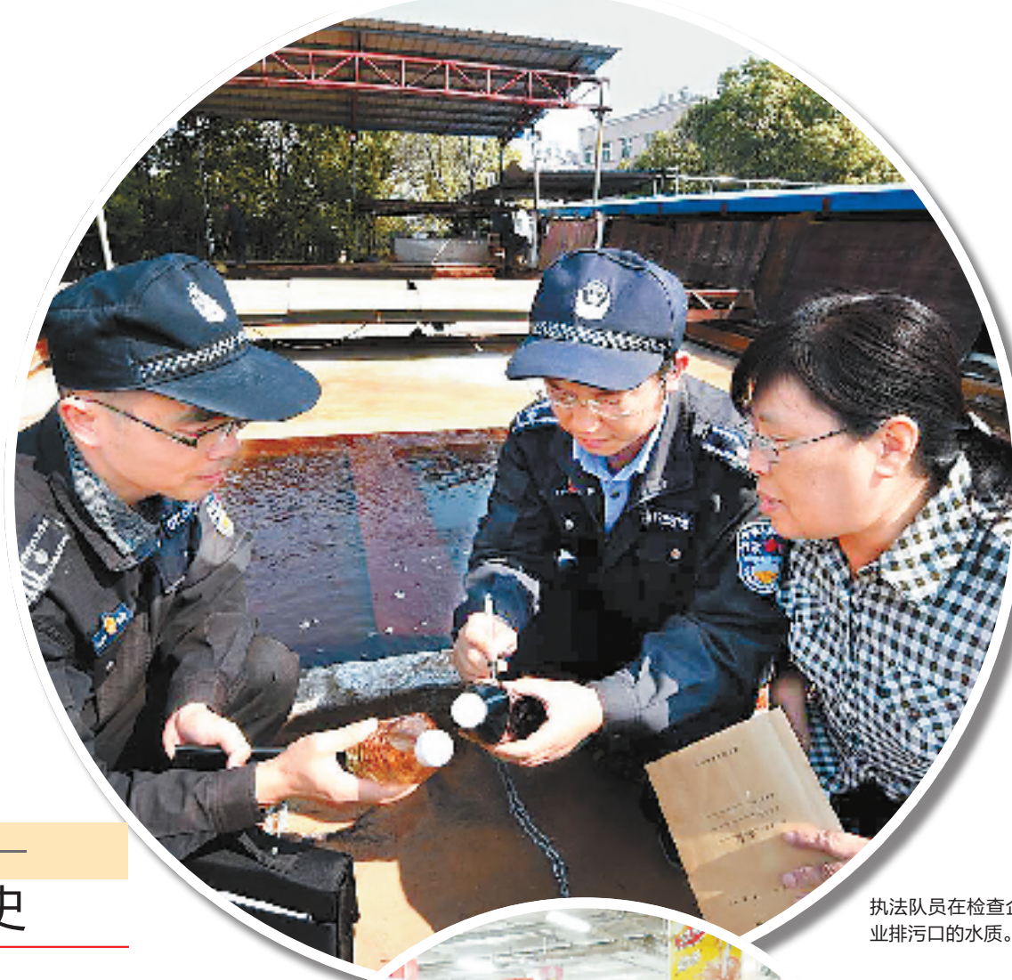
执法队员在检查企业排污口的水质。

“这场改革属于缺什么补什么,跟上了乡镇发展需要。”在我省许多乡镇干部眼中,这次部分执法权的下放可称得上是一场“及时雨”。