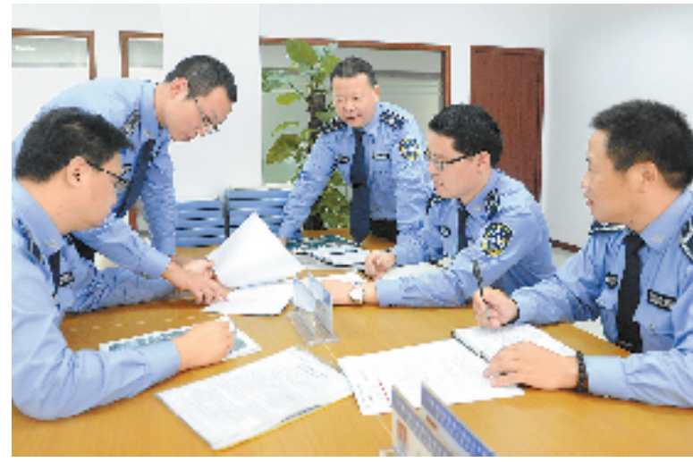
执法人员正在办理的疑难行政案件进行讨论。

网友“只眼看法”:在高速城市化发展中,城市管理的难度加大,但综合行政执法机关仍缺少国家层面在此领域的专门立法,这直接影响城管机关的职能定位。