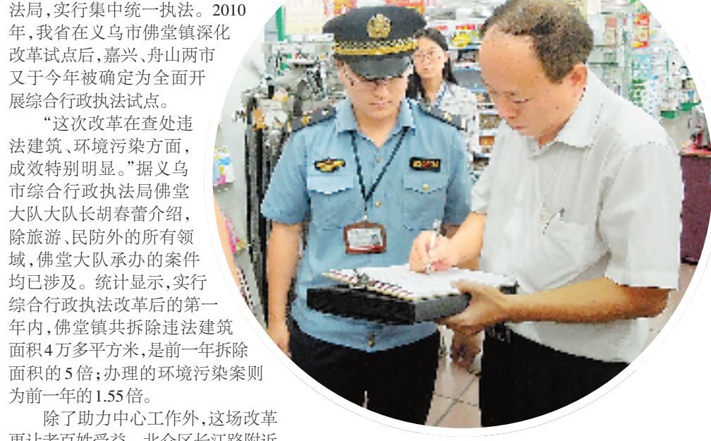
执法队员对某超市明码标价情况进行检查。