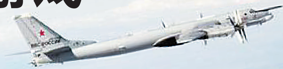
2014年10月29日,挪威军方公布了挪威F-16战机靠近俄罗斯图-95轰炸机飞行的照片。(具体拍摄时间不详)