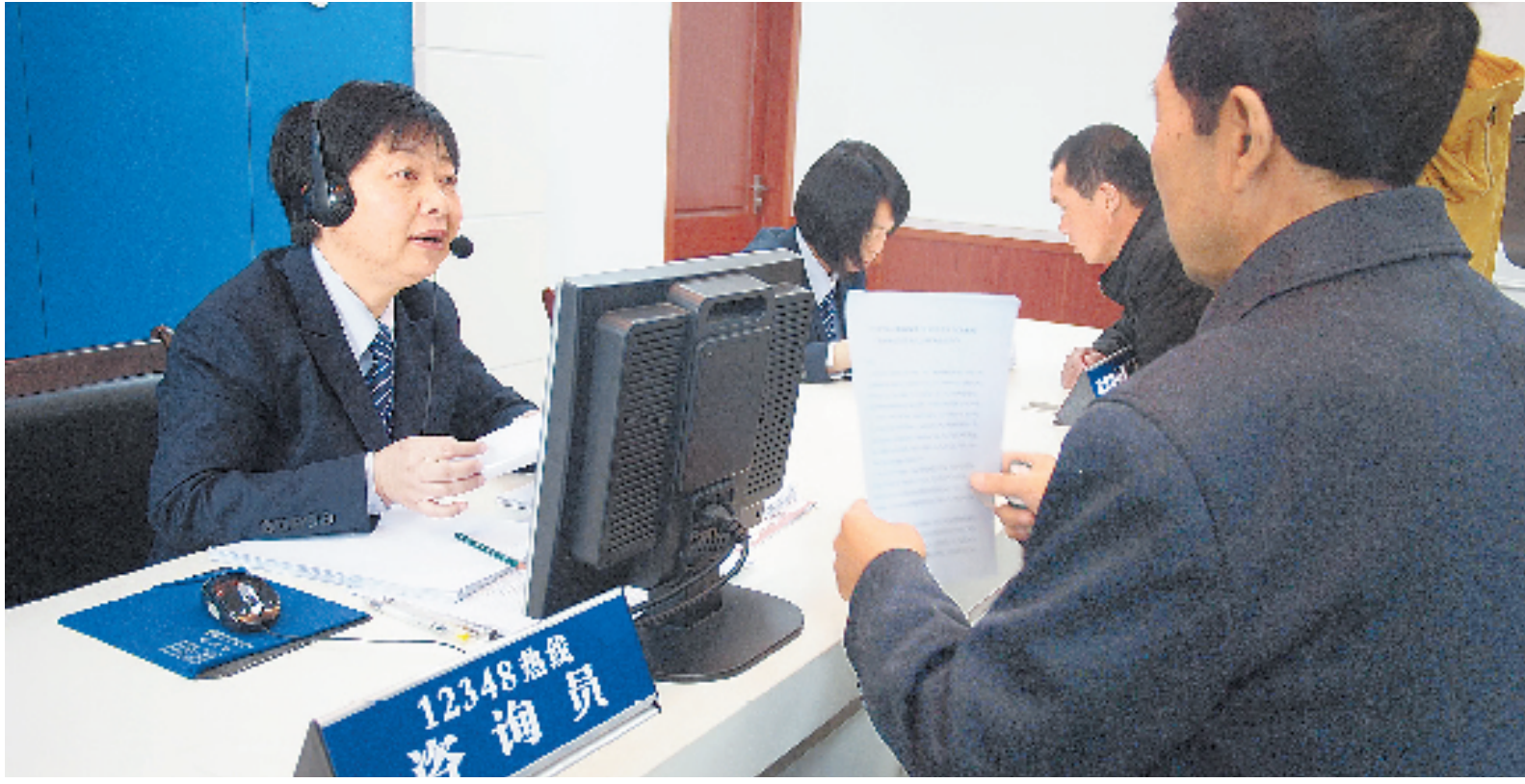
舟山市司法行政法律服务中心,为农民工现场提供法律援助。