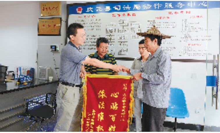
农民工为庆元县司法行政法律服务中心送来锦旗。