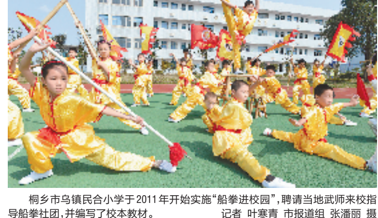
桐乡市乌镇民合小学于2011年开始实施“船拳进校园”,聘请当地武师来校指导船拳社团,并编写了校本教材。记者 叶寒青 市报组 张潘丽

的状态参加杭州国际马拉松赛,亚瑟士公司在10月份组织了杭州马拉松训练营,从诸多跑者中选出40人组成了杭马战队,热身杭马赛道。值得一提的是,除了热身体验跑,当天还将有亚瑟士浙江首家跑步概念店的趣味互动,店中马拉松世界纪录配速的跑步机,供跑友们挑战自我。